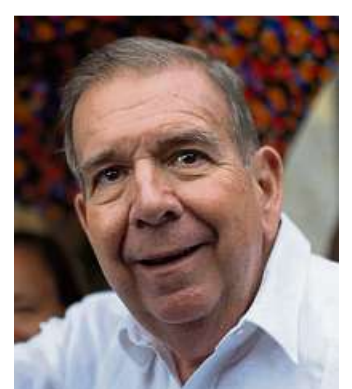
Flucht ins spanische Exil: Edmundo Gonzáles.

Nach der Präsidentschaftswahl am 28. Juli hatte die linientreue Wahlbehörde den seit elf Jahren regierenden autoritären Staatschef Nicolás Maduro zum Sieger erklärt. Sie veröffentlichte allerdings nicht die aufgeschlüsselten Resultate. Die Opposition spricht von Wahlbetrug und reklamiert den Sieg für Gonzáles, gegen den vorige Woche unter anderem wegen Sabotage, Verschwörung, Amtsmaßnung und Aufruf zur Missachtung Haftbefehl erlassen worden war. Auch die USA, die EU und zahlreiche Länder Lateinamerikas zweifeln das Ergebnis an. Nach Angaben der Opposition soll Gonzáles bei der Wahl 67 Prozent der Stimmen erhalten haben, Maduro nur 30 Prozent. Proteste waren von der Staatsgewalt niedergeschlagen worden. Nach Angaben der Menschenrechtsorganisation Provea kamen 25 Personen ums Leben, mehr als