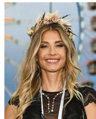
Cathy Hummels

Influencerin Cathy Hummels (36) braucht für das Oktoberfest zwölf Dirndl. „Ich recycle natürlich. Dieses Jahr brauche ich circa zwölf verschiedene Looks. Viele leihe ich mir aus.“ Einige stammten aus ihrer eigenen Kollektion, die sie zur Wiesen bei einem Trachten-Label herausgebracht hat. Sie selbst will auch ein pinkes Dirndl tragen. „Pink steht für Selbstbewusstsein, Weiblichkeit und Kraft.“