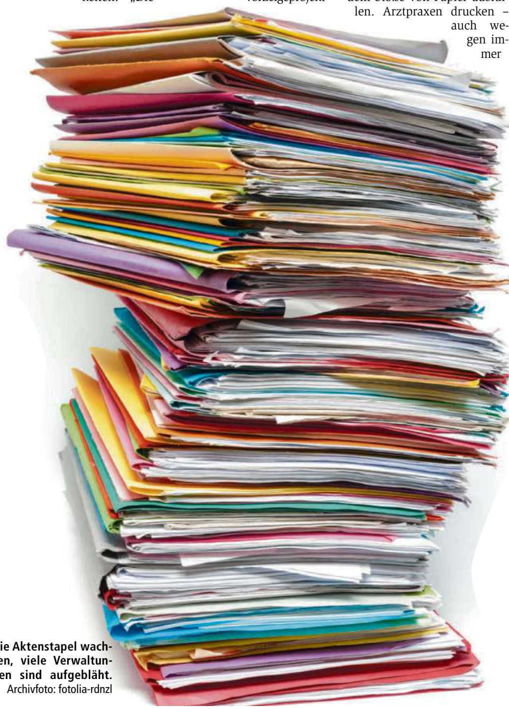
Die Aktenstapel wachsen, viele Verwaltungen sind aufgebläht.

Rechnungshöfe sind gut, um staatlichen Stellen auf die Finger zu schauen. Bisweilen aber übertreiben sie, und Staatsdiener sichern sich aus Angst so sehr ab, dass nichts vorangeht. In der Pandemie setzen sich viele Minister darüber hinweg, nun sitzt der Rechnungshof ihnen im Nacken. „Wer von den Ministern, die hier für Beschaffung zuständig sind, nach der Krise nicht den Landesrechnungshof am Arsch hat, der hat alles verkehrt gemacht“, hatte NRW-Gesundheitsminister Karl-Josef Laumann (CDU) schon damals auf deftige Art gesagt. Die Fluchtministerin von Nordrhein-Westfalen, Josefine Paul (Grüne), hat nach dem Attentat von Solingen eingeräumt, dass es bei Abschiebungen ein „dysfunktionales System“ gebe. Das Problem liegt tiefer. Zeit zum Umkehren – die schnelle Gasbeschaffung in der Energiekrise zeigt, dass es geht.