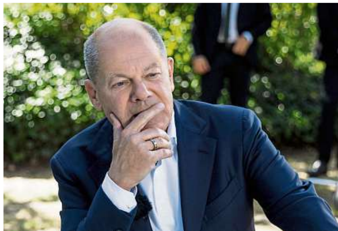
Der Druck auf Kanzler Scholz könnte in zwei Wochen stark zunehmen. Dann wird in Brandenburg gewählt.

Die Sozialdemokraten erzielten bei den jüngsten Landtagswahlen in Thüringen und Sachsen mit 6,1 und 7,3 Prozent ihre bisher schlechtesten Ergebnisse. Anfang Juni hatte die SPD schon bei der Europawahl mit 13,9 Prozent ihr schlechtestes Ergebnis bei einer bundesweiten Wahl eingefahren. Nun richten sich die Augen nach Brandenburg, wo am 22. September ein neuer Landtag gewählt wird. Die Wahl dort ist für die SPD wichtig, weil sie in Potsdam seit 1990 alle Ministerpräsidenten gestellt hat. Sollte der Regierungschef Dietmar Woidke nach elf Jahren an der Macht scheitern, würde der Druck auf Scholz steigen. In Umfragen liegt die SPD in Brandenburg auf Platz 2 hinter der AfD.