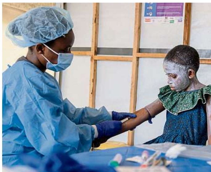
Grundsätzlich spielt das Geschlecht – entgegen anderer Behauptungen – bei Mpox keine Rolle.