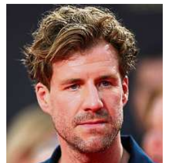
Im August 2021 hatte Luke Mockridge eine Auszeit angekündigt und war seither im Fernsehen kaum mehr in Erscheinung getreten.

Derweil hat Sat.1 entschieden, Mockridges Show „Was ist in der Box?“ am 12. September nicht zu starten, das gab ein Sprecher bekannt. Mockridge zählte einst zu den Sat.1-Sender-Gesichtern.