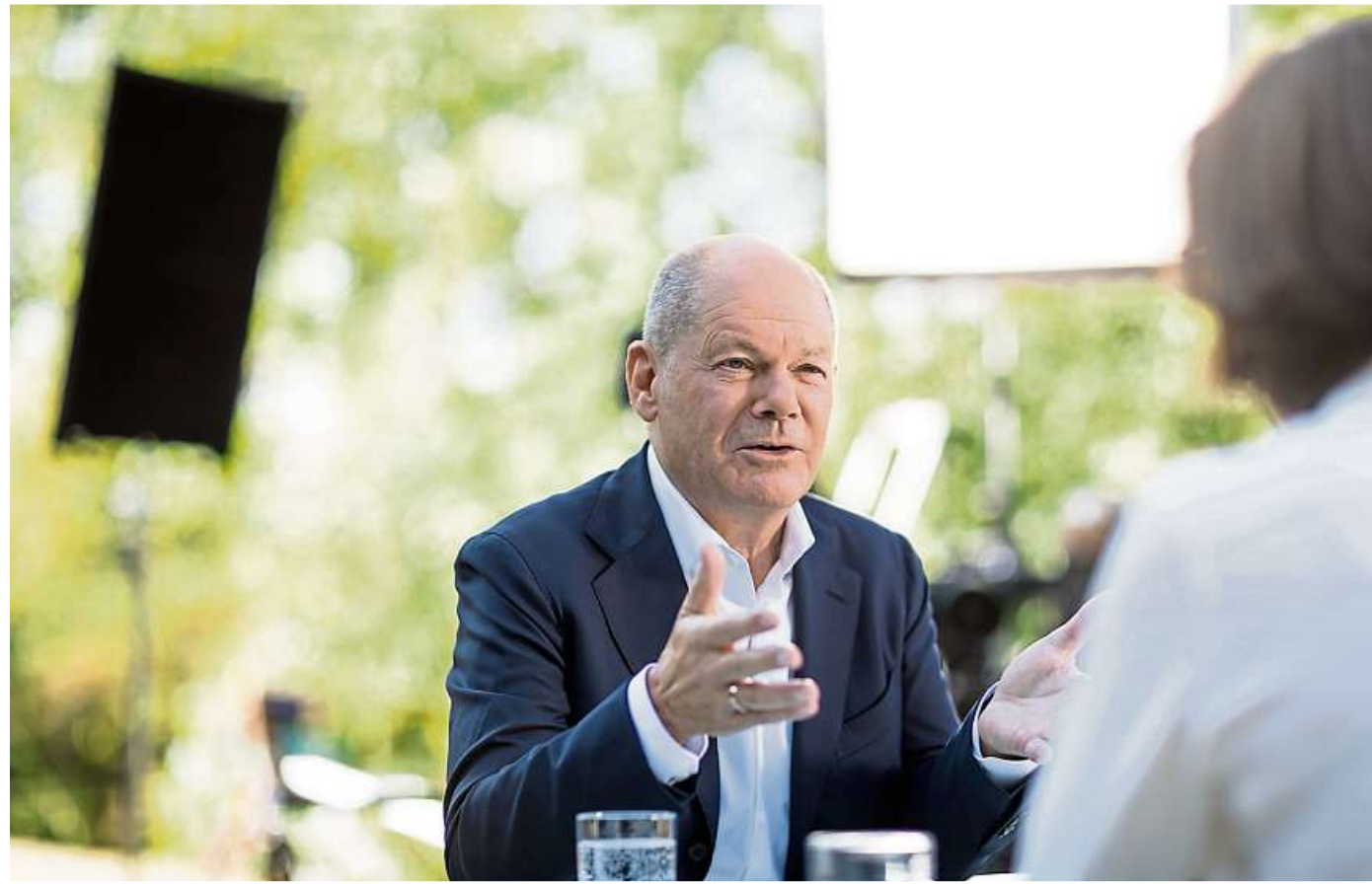
Bundeskanzler Olaf Scholz zeigt sich im Gespräch mit Diana Zimmermann, Leiterin des ZDF-Hauptstadtstudios, zuversichtlich, dass seine SPD wieder in die Regierung gewählt wird.

rung hat eine Mehrheit und sie hat eine Mehrheit, die Aufgaben zu tun, um die es jetzt geht“, sagte Scholz. Die Ampel-Regierung aus SPD, Grünen und FDP habe bereits sehr weitreichende Entscheidungen getroffen. „Und das werden wir auch weiter tun“, sagte Scholz auf die Frage nach der zerstrittenen wie die SPD eine „kämpferische Partei“, fügte Scholz im Hinblick auf die Aufholjagd vor der Bundestagswahl 2021 hinzu.