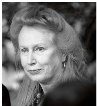
Rebecca Horn wurde 80 Jahre alt.

Horn wurde 1944 in Michelstadt im Odenwald geboren, hatte in Hamburg und London studiert. 2010 wurde sie für ihr Lebenswerk mit dem japanischen Praemium Imperiale geehrt, einem der renommiertesten Kunstpreise der Welt. 2012 folgte die Gründung der Moontower Foundation mit Sitz in Bad König (Odenwald), die ihr Vermächtnis pflegen und Künstler und Musiker fördern soll.