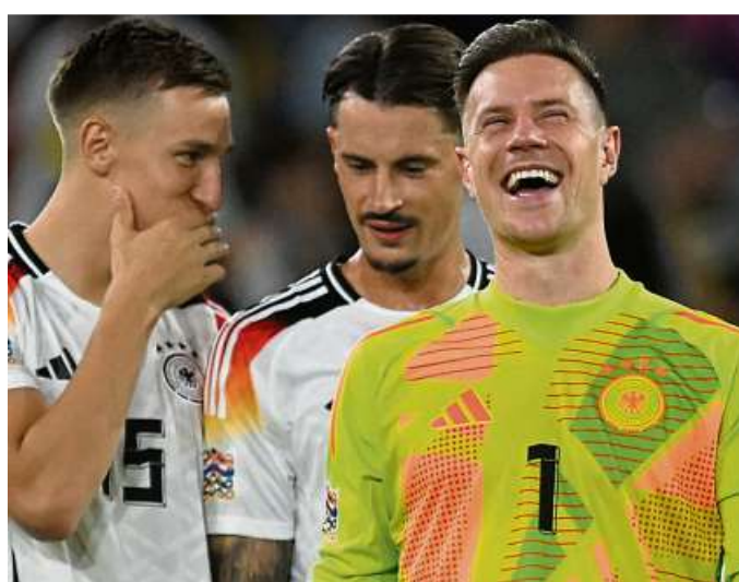
Beste Stimmung nach dem Abpfiff (von links): Nico Schlotterbeck, Robin Koch und Marc-André ter Stegen.

Zunächst hatte Völler im April zwei Monate vor dem Heimturnier seinen Sportdirektoren-Vertrag verlängert. Kurze Zeit später zog der inzwischen 37 Jahre alte Nagelsmann nach. Beide sind bis nach der WM in den USA, Kanada und Mexiko an den DFB gebunden.