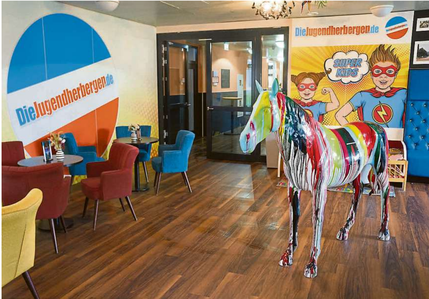
Beispiel Bad Neuenahr: Der modern gestaltete Empfangsbereich der Jugendherberge könnte so auch zu einem Hotel gehören.