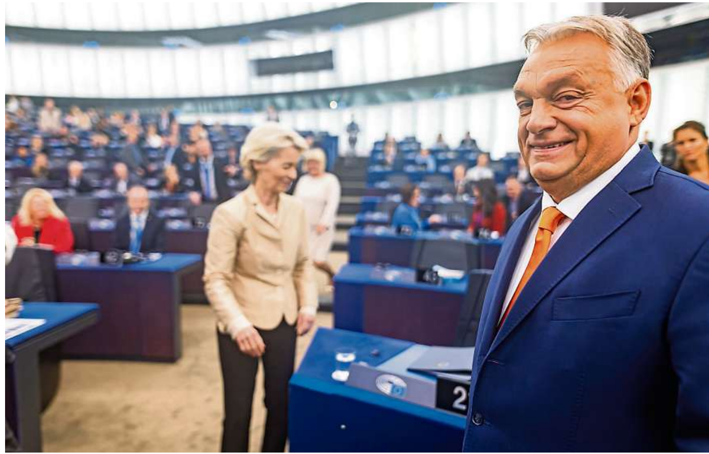
Viktor Orbán (rechts) am Mittwoch im Europaparlament in Straßburg. Eigentlich sollte es in der Aussprache um die Vorhaben der ungarischen Ratspräsidentschaft gehen. Es kam ganz anders.

Zunächst sieht es danach aus, als hätten sich der Rats- und die Kommissionspräsidentin für das Florett und andeutete Treffer entschieden. Orbán bezeichnet sich selbst als „ehrlichen Makler“, für den es „eine Ehre“ sei, von den Abgeordneten angehört zu werden. Diese wolle er davon überzeugen, dass sich die Europäische Union wandeln müssen, um die Krisen bei Migration und Wettbewerbsfähigkeit bestehen