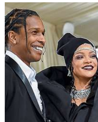
Rihanna mit Freund Asap Rocky

Rapper Asap Rocky spricht von seiner ersten Begegnung mit seiner heutigen Partnerin, Superstar Rihanna (36), in einer ziemlich unangenehmen Situation. „Ich wurde aus diesem Nachtclub rausgeschmissen“, erzählte der 36-jährige Musiker. Der Rapper, der mit bürgerlichem Namen Rakim Mayers heißt, geriet eigenen Worten zufolge damals mit den Rüststernen aneinander, als Rihanna rauskam.