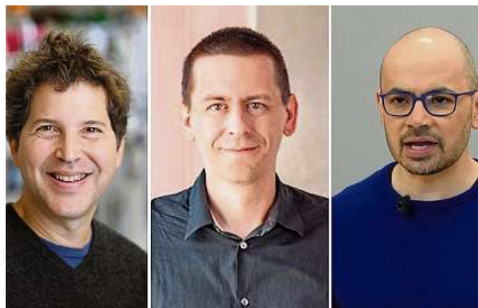
Ausgezeichnet: David Baker (links), John Jumper (Mitte) und Demis Hassabis. Hassabis war mit 13 Jahren schon Schachmeister und programmierte als Jugendlicher Computerspiele.

Hassabis (48) und der 1985 geborene Jumper haben ein KI-Modell entwickelt, um ein jahrzehntealtes Problem zu lösen: die Vorhersage der Strukturen von Proteinen. Jumper