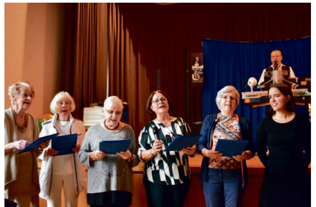
Das Helferteam präsentierte zum Jubiläum ein selbst gedichtetes Jubiläumslief zur Melodie von „Mein Vater war ein Wandersmann“.