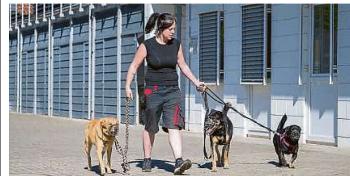
Die Tierheime nehmen die geretteten Tiere auf, hier ist die Lage weiter angespannt.

„Ein direkter Bezug zu den Zahlen des LKA lässt sich zwar nicht herstellen. Aber generell bleibt die Lage in deutschen Tierheimen angespannt.“