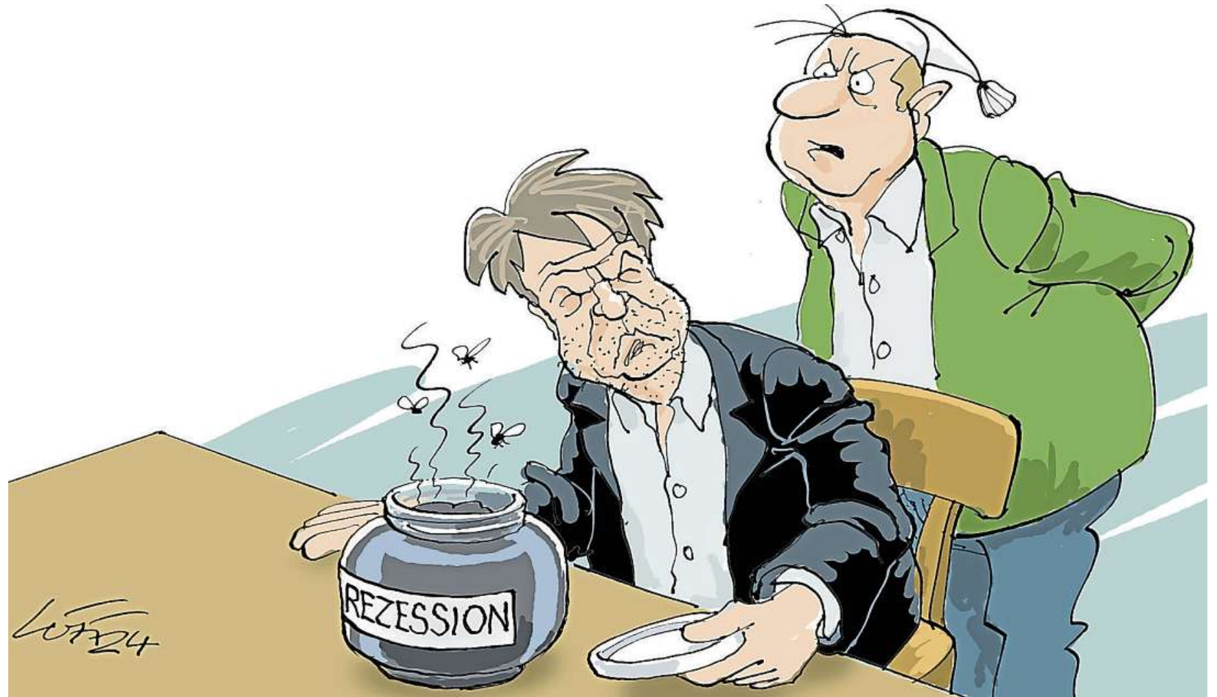
„Na, hausgemacht, was?!“

Der Abstieg der Klimaheiligen Greta zur glühenden Antisemitin und Mitläuferin gewalttätiger Demonstranten (...) ist atemberaubend. Aber er ist keinesfalls so überraschend, wie ihre Verehrer von früher nun tun: Ihre grenzenlose Wut, die Klima-Apokalyptik, ihr Wunsch, Menschen in Endzeitpanik zu versetzen, der Quatsch, andere hätten ihr die Zukunft gestohlen, ihr Hass auf die Politiker, all das war lange schon da. (...) Nun empört sich Greta über deutsche Polizeigewalt. Sie sollte sich das nicht mehr antun, den deutschen Unrechtsstaat künftig meiden und so dem von der Union geforderten Einreiseverbot zuvorkommen.