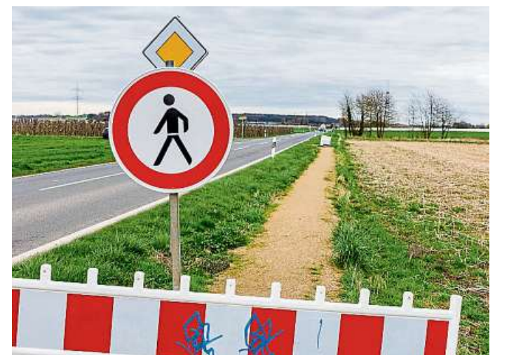
Ein Fall aus dem Schwarzbuch: Ein nur 300 Euro teurer provisorischer Fußweg entlang der L123 im westfälischen Wachtberg, damit Fußgänger nicht länger am Fahrbahnrand laufen müssen, wurde gesperrt, weil er nicht den Vorschriften entsprach. Jetzt muss er für 100.000 bis 200.000 Euro neu geplant werden.

Neben dem Schwerpunkt-Kapitel über Bürokratie nimmt der Verein auch unter anderem Kosten bei „Brücken, Straßen und Verkehr“ sowie die skurrile Nutzung öffentlicher Gelder unter die Lupe.