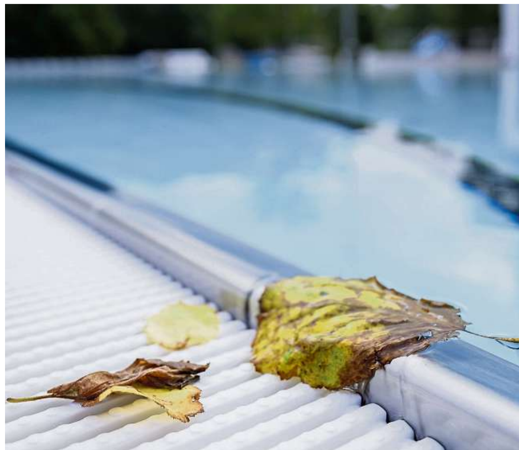
Wer einen Pool unter Nachbars Eichen baut, kann nachher keine Entschädigung für den Laubfall verlangen.

Der Sachverständige kam zu der Einschätzung: Insgesamt halte sich der Eintrag an Eichel, Laub und Totholz im üblichen Rahmen. Es hätte auch nichts wesentlich geändert, wenn beim Pflanzen der Eichen der Grenzabstand eingehalten worden wäre. Somit müsse die Klägerin den erhöhten Reinigungsaufwand hinnehmen.