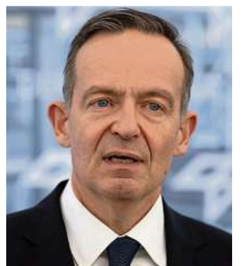
Bundesverkehrsminister Volker Wissing.

BERLIN. Der Bundesrechnungshof kritisiert die Bahnpolitik von Bundesverkehrsminister Volker Wissing (FDP). Das Ministerium scheiterte beim Steuern der Deutschen Bahn AG, heißt es in einem Bericht des Rechnungshofs an den Haushaltsausschuss des Bundestags. Das Bundesministerium habe 2022 angekündigt, die bundeseigene Deutsche Bahn besser steuern und sie stärker an den Bundesinteressen ausrichten zu wollen. „Dies ist nicht gelungen“, so der Rechnungshof. Eine ressortinterne Steuerungsgruppe habe nicht die nötige „Wirkkraft“ entfaltet. Der Bund ist Alleineigentümer der Deutschen Bahn AG.