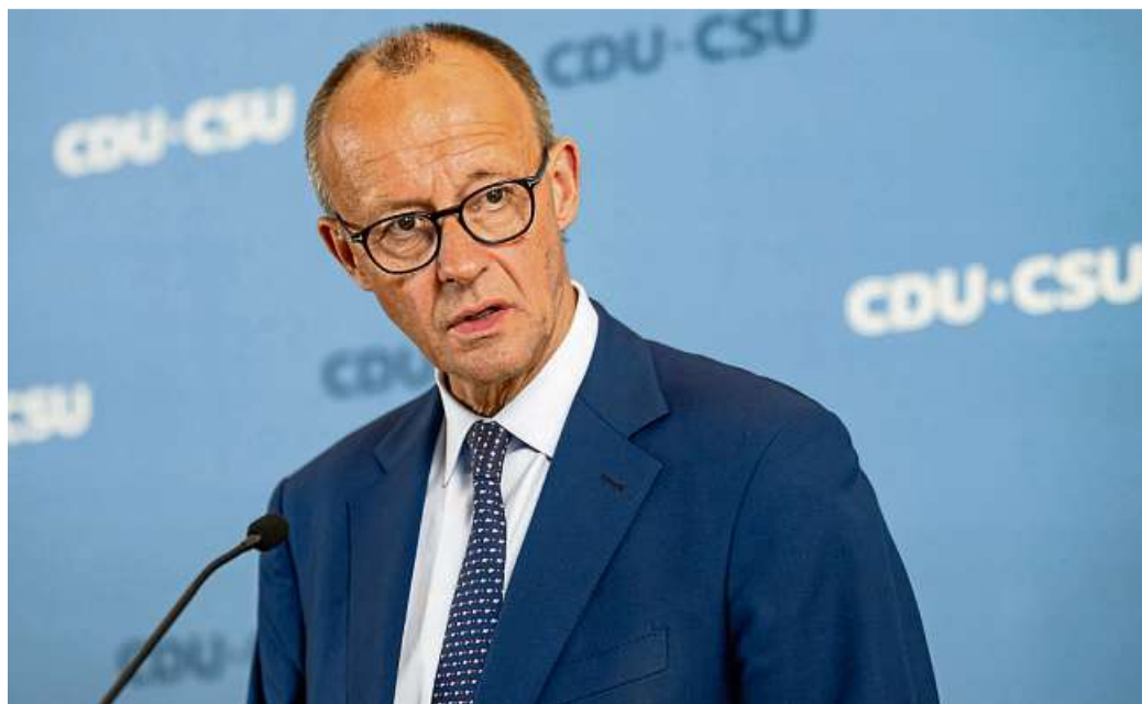
Friedrich Merz versucht derzeit einige Probleme abzuräumen, die in der Partei teils öffentlichkeitswirksam diskutiert werden, ihr aber nur wenig nutzen.

Das ewige Grünen-Bashing: Inzwischen fürchtet man zudem in der Partei, dass das offensive Grünen-Bashing aus Bayern seitens der CSU und ihrem Chef Markus Söder ein solcher Selbstläufer wird, dass die Möglichkeit am Ende tatsächlich zerbröckelt sein könnte. Merz hingegen hofft nach der Bundestagswahl zumindest auf hessische Verhältnisse, er also wählen kann zwischen SPD und Grünen als Koalitionspartner. Am Samstag hält Merz als Kanzlerkandidat eine Rede auf dem CSU-Parteitag in Augsburg. Seine Ansagen in Sachen Grüne werden besondere Beachtung finden.