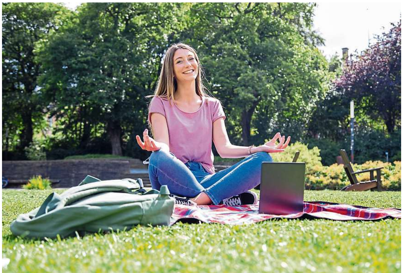
Wer sich rechtzeitig mit Prüfungsangst auseinandersetzt, kann vielleicht bald auch so entspannt in die Prüfungsphase gehen.

Ebenso kann fehlende oder falsche Vorbereitung auf Prüfungen eine Rolle spielen. Besonders der Übergang von der Schule zum Studium kann schwierig sein, wenn plötzlich viel mehr Lernstoff bewältigt werden muss. Und wenn Unsicherheit darüber besteht,