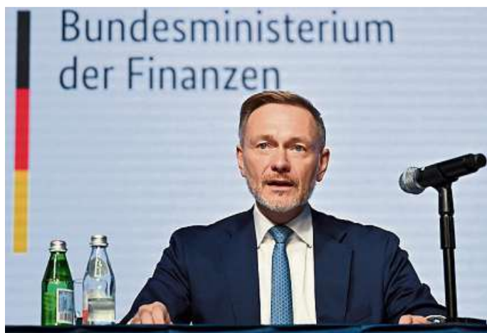
Es sieht düster aus: Finanzminister Christian Lindner stellt in Washington das neue Zahlenwerk der Steuerschätzer vor.

Die schlechte Konjunktur beschert Lindner durch einen Mechanismus in der Schuldenbremse aber auch Spielraum für neue Kredite. 5,4 Milliarden Euro darf der Minister 2025 mehr aufnehmen als zunächst gedacht. Doch auch das helfe nicht beim Stopfen der Finanzierungslücke, sagt Lindner. Denn das Geld werde vollkommen aufgefressen durch die konjunkturellen Mindereinnahmen.