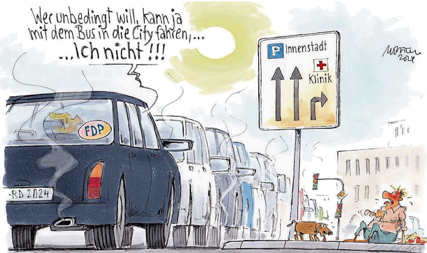
Karikatur: Gerhard Mester