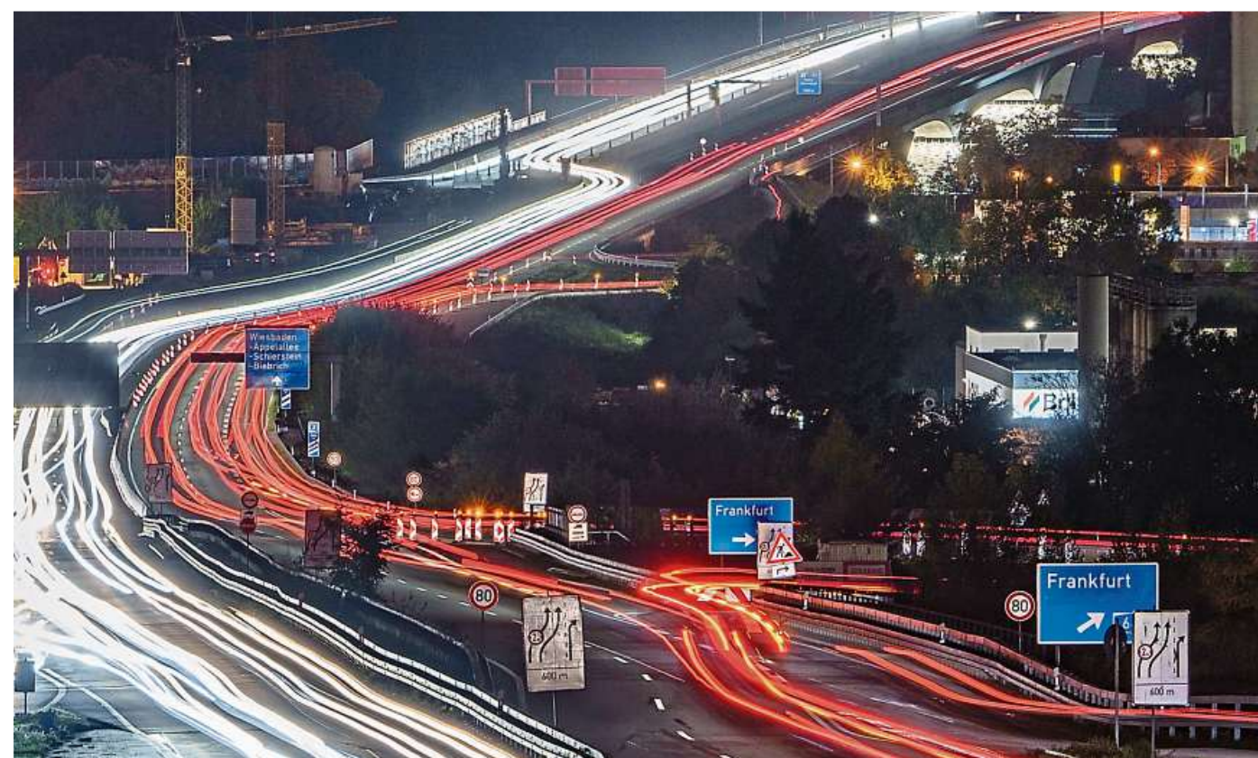
Auto an Auto: Tagtäglich bahnt sich der Berufsverkehr seinen Weg über die Schiersteiner Brücke zwischen Wiesbaden und Mainz.

Bei der Verkehrsprognose handelt es sich um langfristige Szenarien, die die Verkehrsentwicklung bis 2040 unter bestimmten Bedingungen abbilden.