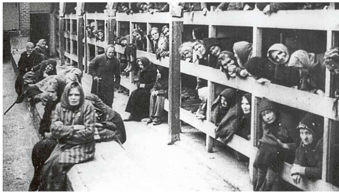
Blick in eine der Baracken des Frauenlagers in Auschwitz-Birkenau am Tag der Befreiung.

Ein Großteil der Befragten gab etwa an, eher viel oder sehr viel über Nationalsozia-