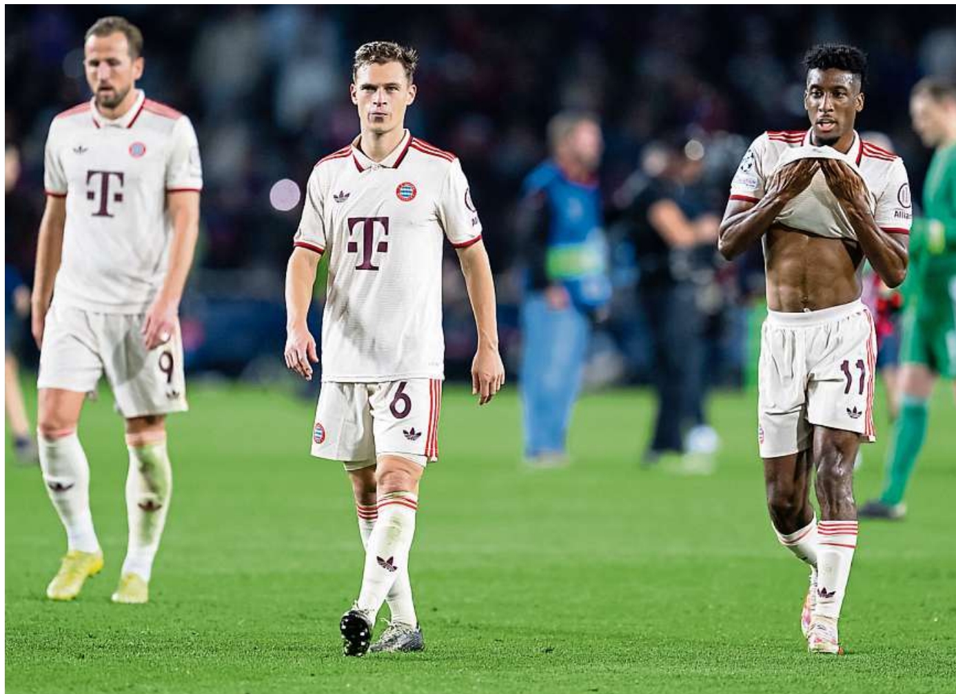
Enttäuschte Bayern nach dem Abpfiff: (von links) Harry Kane, Joshua Kimmich und Kingsley Coman.

Claudia Pechstein: Die Eisschnelllauf-Olympiasiegerin muss weiter auf einen Abschluss ihres Millionen-Prozesses gegen den Weltverband warten. Bei der Verhandlung vor dem Oberlandesgericht München wurde eine Entscheidung vertagt. Die Isu lehnte einen vom Richter angeregten Vergleich ab. Pechstein klagt wegen einer ihrer Meinungen nach zu Unrecht verhängten zweijährigen Doping-Sperre im Jahr 2009. Sie fordert fast 8,4 Millionen Euro.