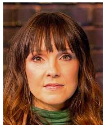
Carolin Kebekus

Seit Komikerin Carolin Kebekus (44) Mama ist, fällt ihr der gesellschaftliche Druck auf Frauen und insbesondere Mütter noch mehr auf als zuvor. „Alles, was man als Mutter macht, wird bewertet, als hätte man ein Produkt für die Gesellschaft geschaffen und muss jetzt so agieren, wie es alle gern hätten“, sagte Kebekus dem Redaktionsnetzwerk Deutschland (RND).