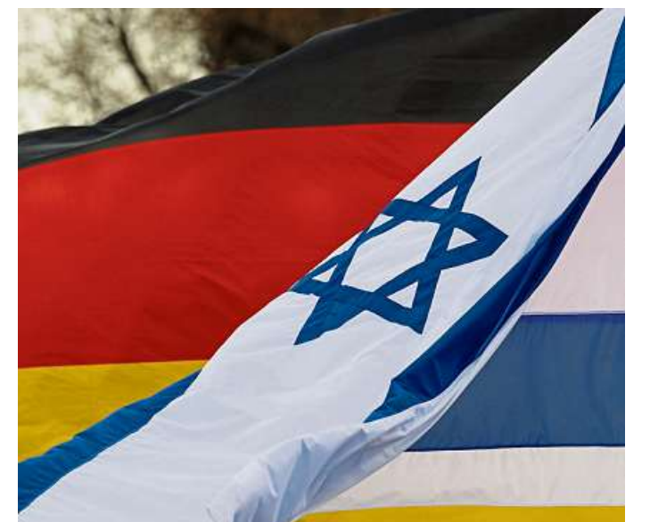
Deutsche Rüstungsexporte nach Israel haben wegen des Krieges im Nahen Osten eine besondere Brisanz.

Einer Forsa-Umfrage zufolge sind 60 Prozent der Deutschen gegen Waffenlieferungen an Israel. Nur 31 Prozent waren dafür, neun Prozent äußerten sich unentschieden. Dagdelen nannte die Exporte „unverantwortlich“. Die Ampel-Regierung leiste „Beihilfe für Kriegsverbrechen in Gaza und Libanon“.