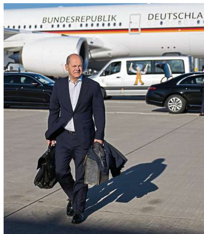
Bundeskanzler Olaf Scholz auf dem Weg zu einer Maschine der Flugbereitschaft der Luftwaffe, um nach Indien zu reisen.

Sicherheit: Deutschland und Indien haben vor mehr als 20 Jahren eine strategische Partnerschaft abgeschlossen und wollen ihre Zusammenarbeit im Sicherheitsbereich intensi-